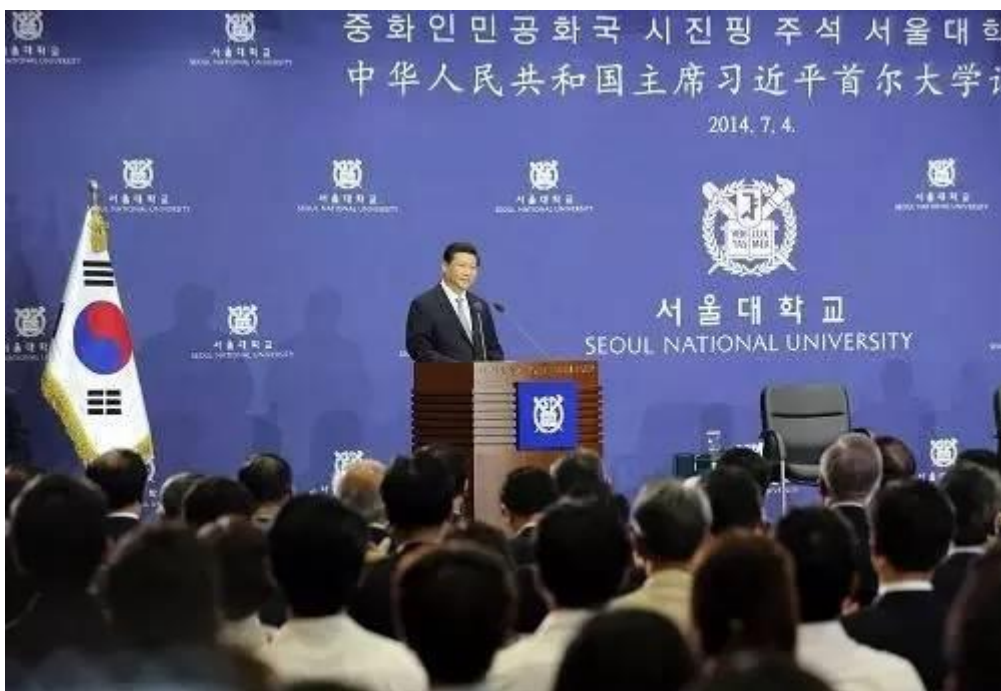
2014年7月4日，国家主席习近平在韩国国立首尔大学发表题

南开大学 APEC 研究中心主任刘晨阳评论说，全方位基础设施与互联互通建设将为 APEC 合作的“车轮”铺设更加平坦、宽阔的前进道路。